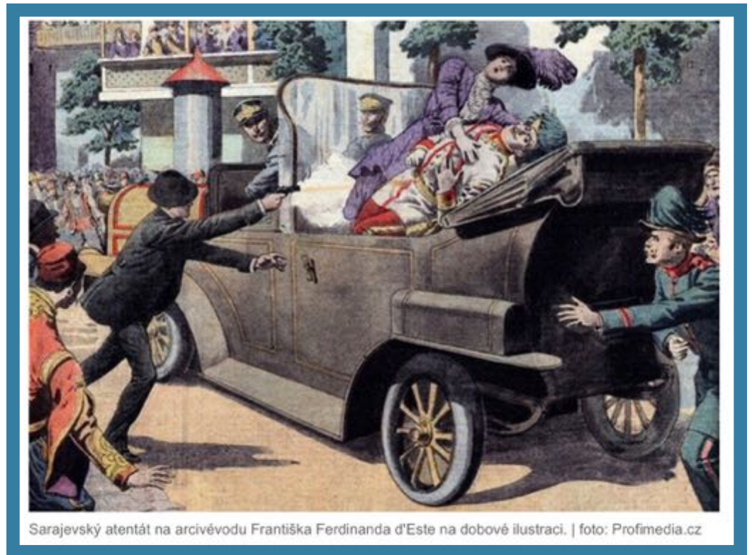
Sarajevský atentát na arcivévodu Františka Ferdinanda d'Este na dobové ilustraci.